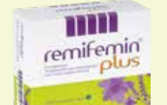
remifemin plus* 100 Filmtabletten