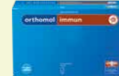
orthomol immun Granulat 30 Tagesportionen