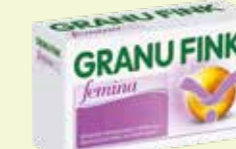
GRANU FINK femina* 60 Kapseln