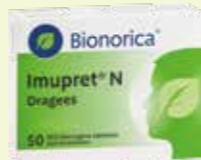
Bionorica Imupret N* 50 Dragees