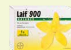
Laif 900 BALANCE* 60 Filmtabletten

Ab sofort erreichen Sie Ihre Apotheke auch per WhatsApp!