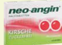
neo-angin HALSTABLETTEN KIRSCH ZUCKERFREI* 24 Lutschtabletten