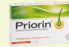
Priorin 120 Kapseln