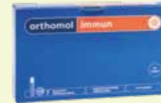
orthomol immun 7 Tagesportionen