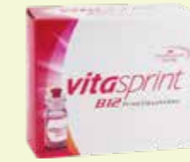
vitasprint B12 Trinkfläschchen* 30 Trinkfläschchen