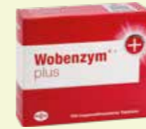
Wobenzym plus* 100 Filmtabletten