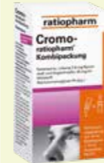
Cromo-ratiopharm Kombipackung Nasenspray und Augentropfen* 1 Kombipackung