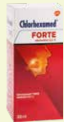
Chlorhexamed FORTE alkoholfrei 0,2%* 300 ml