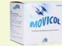
MOVICOL* 50 Beutel