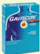
GAVISCON ADVANCE Pfefferminz* 12 x 10 ml