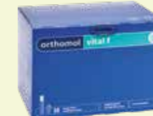
orthomol vital f Trinkfläschchen/Kapsel 30 Tagesportionen