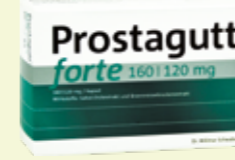
Prostagutt forte 160/120 mg* 120 Kapseln