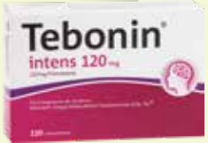
Tebonin intens 120 mg* 120 Filmtabletten