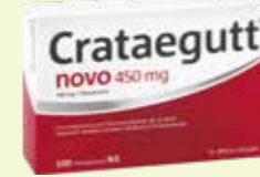
Crataegutt novo 450 mg* 100 Filmtabletten