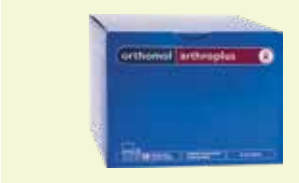
orthomol arthropus 30 Tagesportionen