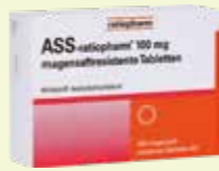
ASS-ratiopharm 100 mg magensaftresistente Tabletten* 100 Tabletten