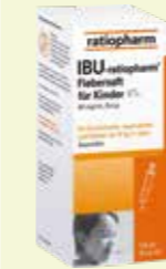
IBU-ratiopharm 4% Fiebersaft für Kinder* 100 ml