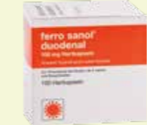
ferro sanol duodenal* 100 Hartkapseln