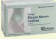
Sidroga Blasen-Nieren-Spültee* 20 Filterbeutel