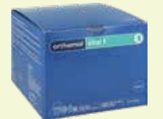
orthomol vital f 30 Tagesportionen